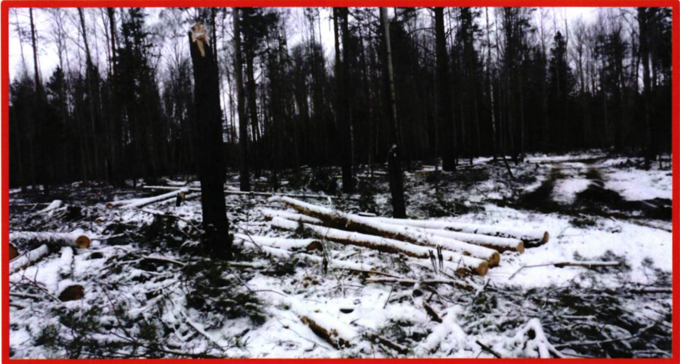
Изображение № 7 Брошенная древесина вдоль лесовозных дорог. Не является валежником