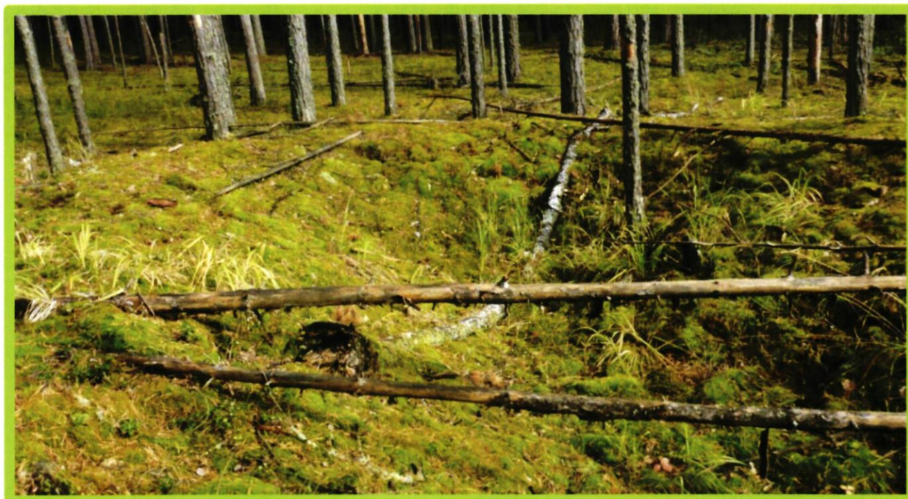
Изображение № 1 Валежник

Примеры валежника (смотри изображения №№ 1,2,3).