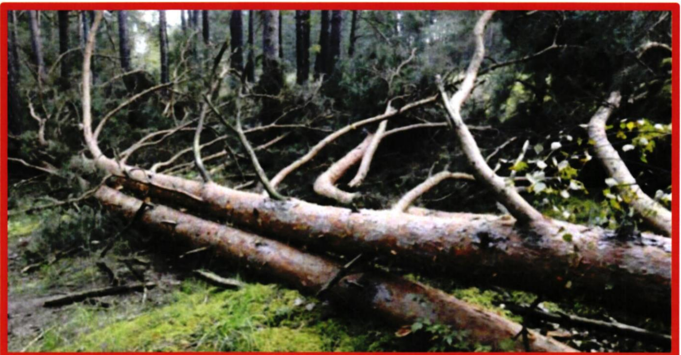
Лежащее на поверхности земли ветровальное дерево, не имеющее признаков отмирания. Не является валежником

Кроме того, необходимо обратить внимание, что деревья, которые лежат на земле, но не имеют признаков естественного отмирания (имеют зеленую листву или хвою), определять как «мертвые» не допускается ( смотри изображение № 5 ).