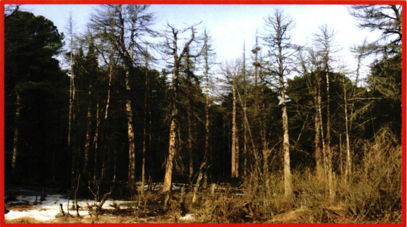
Изображение № 4 Сухостойное дерево. Не является валежником Изображение № 5

Кроме того, необходимо обратить внимание, что деревья, которые лежат на земле, но не имеют признаков естественного отмирания (имеют зеленую листву или хвою), определять как «мертвые» не допускается ( смотри изображение № 5 ).