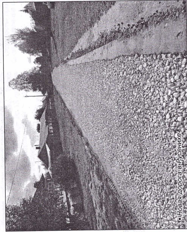
• Новая дорога в Русенихе